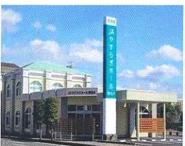
やすらぎホール瀬名川 (家族葬専用ホール)