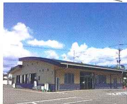
やすらぎホール千代田