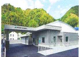
やすらぎホールせんだい