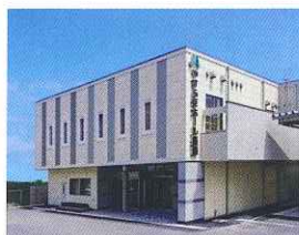
やすらぎホール長田